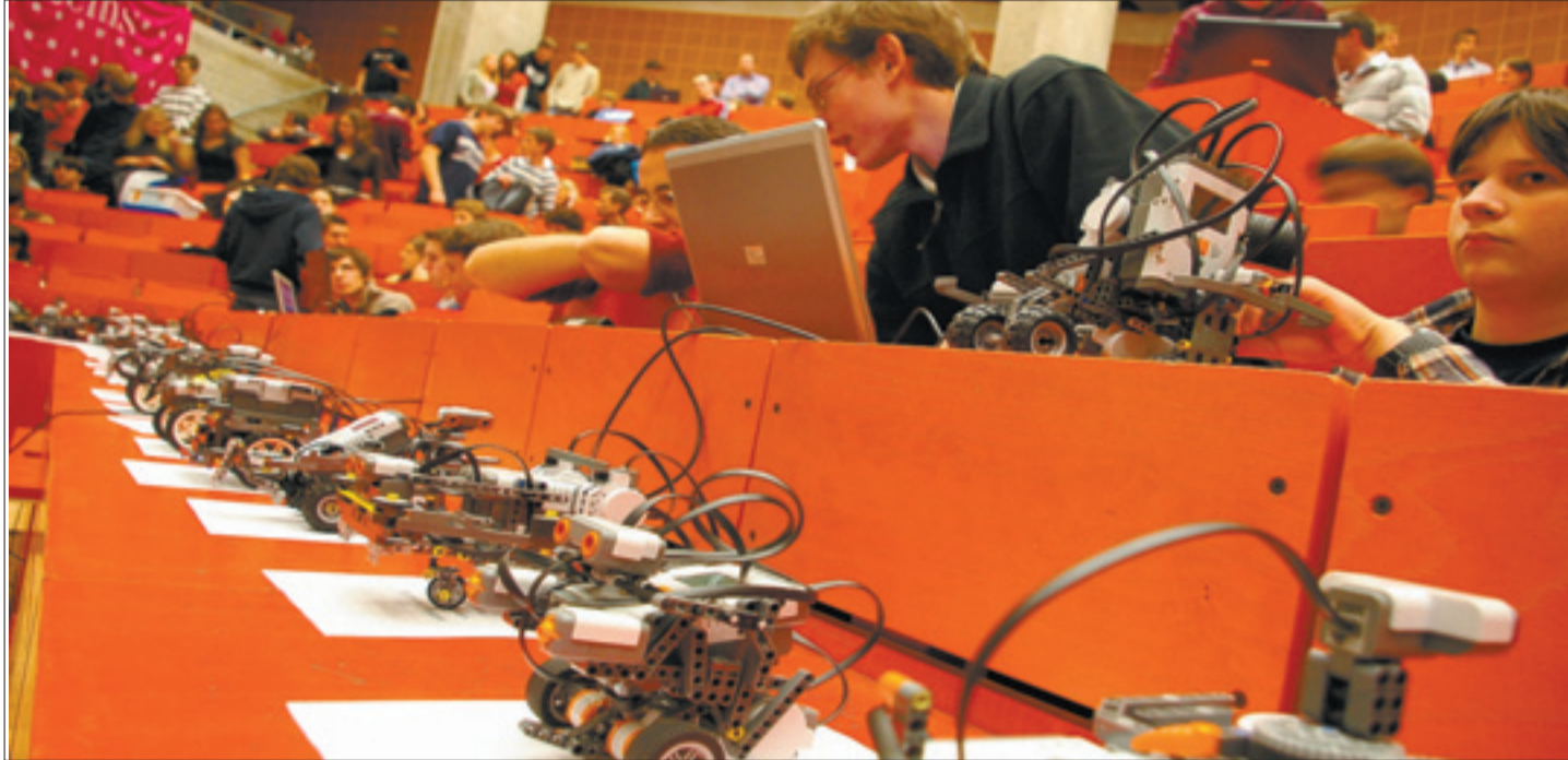
130 Schüler beteiligten sich an dem Wettbewerb und bauten 25 Roboter.

Den schnellsten Roboter hatten jedoch „Die Plagiatoren“ vom Gymnasium in Möckmühl gebaut. Dafür bekam das Team einen Gutschein für einen Rundflug über Stuttgart. Der Roboter der Plagiatoren raste in 8,13 Sekunden durch das Labyrinth. Doch die Vorstellung blieb leider einmalig. Denn beim