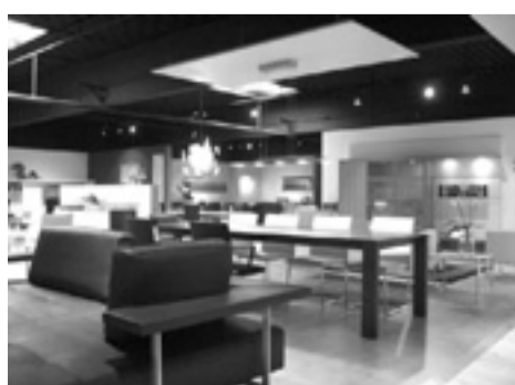
Ausstellungsstücke aus allen Wohnbereichen reduziert.

Einrichtungshaus in Frickenhausen plant Umgestaltung - hochwertige Ausstellungsmöbel reduziert. Sonntag Schausonntag von 13 bis 17 Uhr.