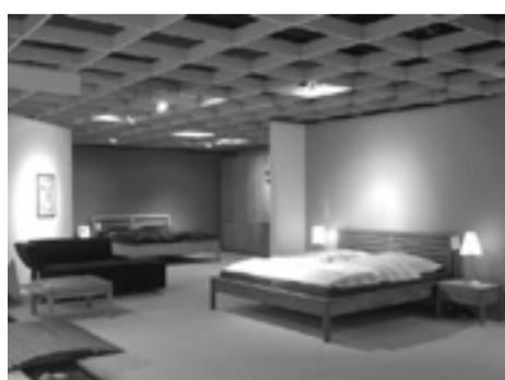
Teilträumungsverkauf in der Schlafzimerabteilung.

Das single möbelforum präsentiert auf 4.500 qm hochwertige Markeneinrichtung. Mit dem Inventur- und Teilträumungsverkauf möchte man nun Platz schaffen für neue Ideen.