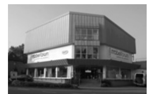
Firmensitz des Familienunternehmens in Frickenhausen. Öffnungszeiten: Mo-Fr 9.30 bis 13.00 und 14.00 bis 19.00 Uhr, Sa 9.30 bis 16.00 Uhr.

Am kommenden Sonntag, den 25. November stehen von 13 bis 17 Uhr im single möbelforum in Frickenhausen, Nürtinger Str. 11, für einen Ideenrundgang die Türen offen.